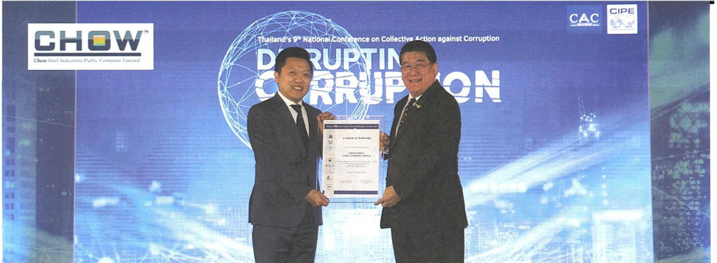
กลุ่มบริษัท CHOW รับมอบใบรับรองโครงการแนวร่วมปฏิบัติของภาคเอกชนไทย ในการต่อต้านการทุจริต (CAC) เป็นสมาชิกแนวร่วมปฏิบัติของภาคเอกชนไทยในการต่อต้านการทุจริต

หัวข้อข่าว: CHOW: กลุ่มบริษัท CHOW รับมอบใบรับรองโครงการแนวร่วมปฏิบัติของภาคเอกชนไทย